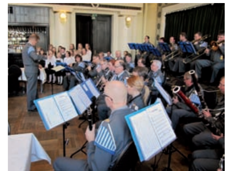
■ Kiltasoittokunta Päämajan Soittokunta esiintymässä lapsikuoron kanssa veteraaneille.

Sotilasmusiikkikilta työskentelee sen eteen, että maamme nykyinen sotilassoittokuntatoiminta voisi hyvin. Haluamme toiminnallamme vaikuttaa siihen, että meillä on jatkossakin taidokas ammattisotilassoittokuntien joukko ja sitä tukemassa kunkin alueen maanpuolustussoittokunnat parhaansa mukaan.