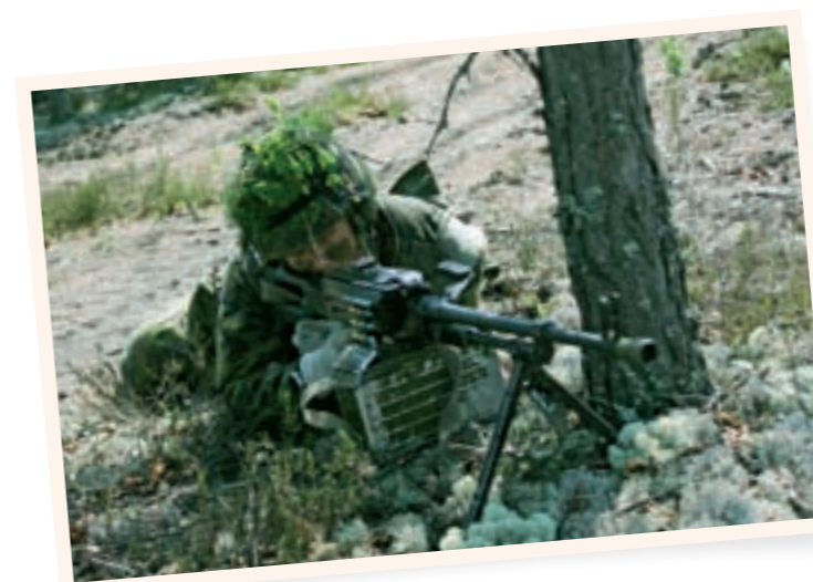
■ Yläkuva: Porin prikaatin 3. Jääkärikomppanian pasi lähtemässä hyökkäykseen

■ TEKSTI: EINO JÄRVINEN