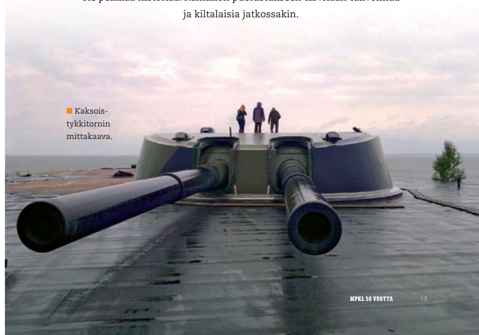
■ Kaksois- tykkitornin mittakaava.

Suomenlinnan Rannikkotykkikilta tekee merkittävää maanpuolustustyötä ja tukee merivoimia alueellaan. Samalla Kiltta tekee korvaamattoman arvokasta perinnetyötä pääkaupunkimme – rajakaupunki – Helsingin edustalla. Rannikkotykkistö ei kuitenkaan ole pelkkää historiaa. Rannikon puolustukseen tarvitaan tulivoimaa ja kiltalaisia jatkossakin.