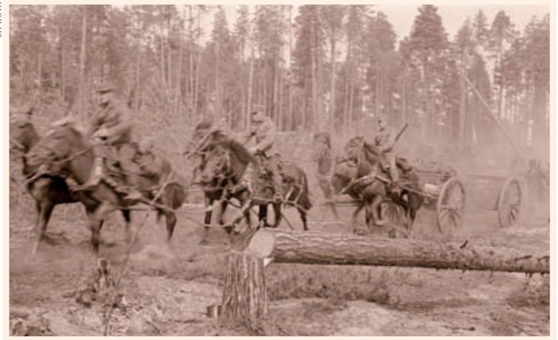
■ Tykki ajaa ravia tuliasemiin. Repola-Ontrosenvaara 7.8.1941.