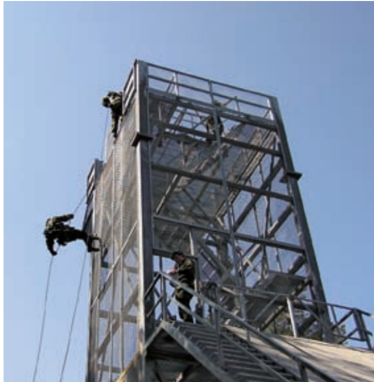
■ Santahamina 2005: Reserviläisistä muodostettu kaupunkijääkäriryhmä esittelemässä taitojaan.

sujuvasti kielen englanniksi tiedusteltuaan ensin, että sopiiko se kuulijoille.