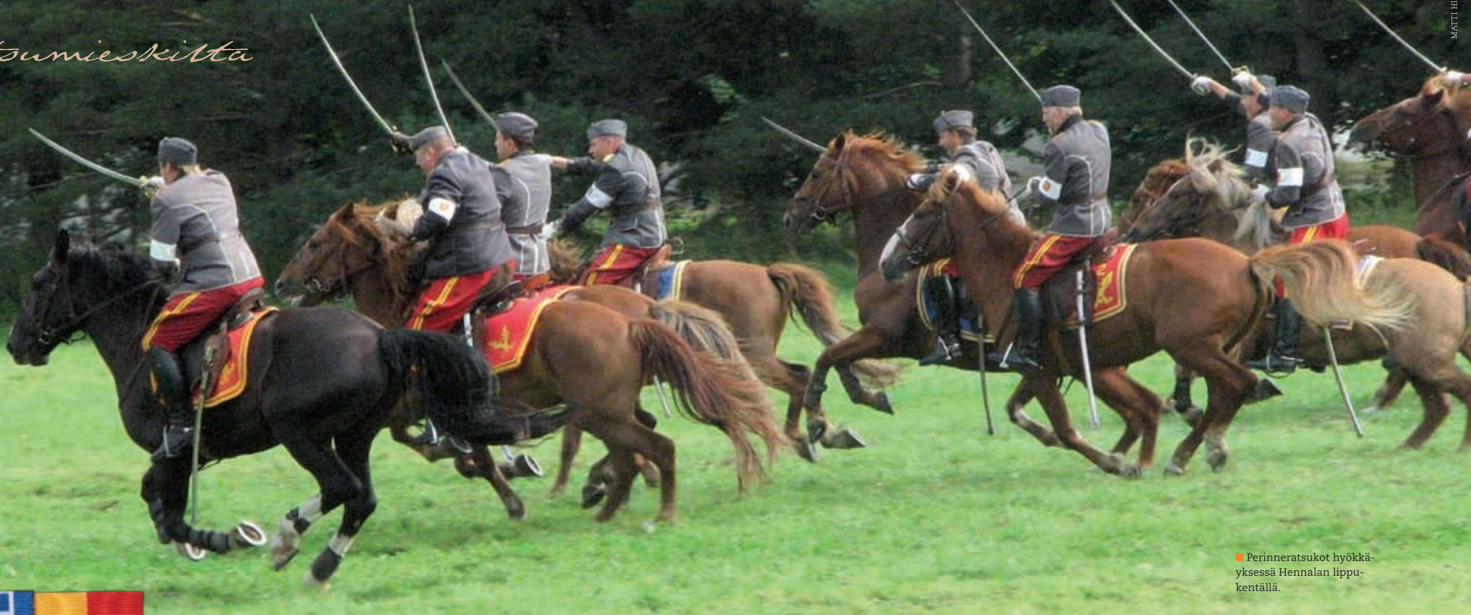
Perinneratsukot hyökkäyksessä Hennalan lippukentällä.