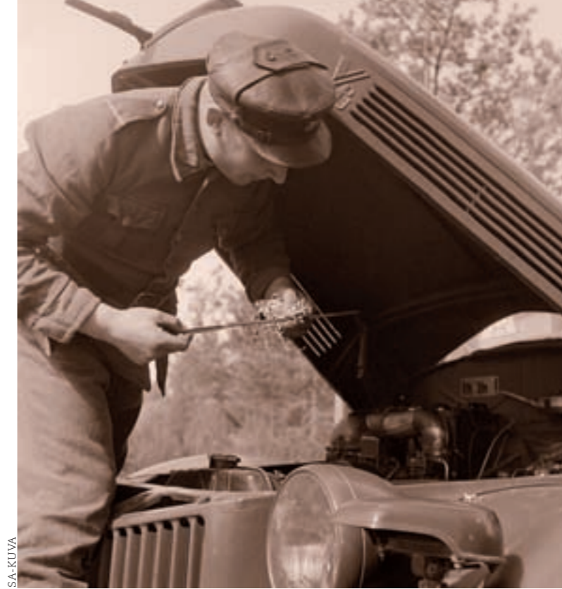
■ Kuljettaja tarkastaa öljyn ennen ajoa. Aunuksenlinna, Ruohosen autokomppania 6.5.1943.

Autojoukkojen pääkillan perustamisen jälkeen syntyi autojoukkojen paikallisosastoja, joista Autojoukkojen Helsingin kiltä ry (AJHK) aloitti toiminnan vuonna 1964 vaikka perustamisko-