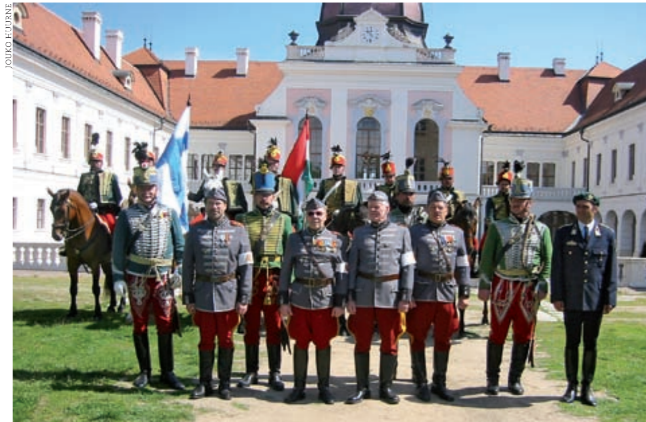
■ Ratsumieskilleden toiminta on kansainvälistä ja komeaa, niin kuin ratsuväessä on tapana. Tässä kiltalaiset vierailulla unkarilaisten husaarien luona – husaarien kotimaassa – Gödölön linnassa vuonna 2005.

aa edelleenkin ja on tuonut uusia, nuoria ja naisiakin jäsenkuntaan. Tuorein ratsuosaston perustaja on Lahden Eskadroona.