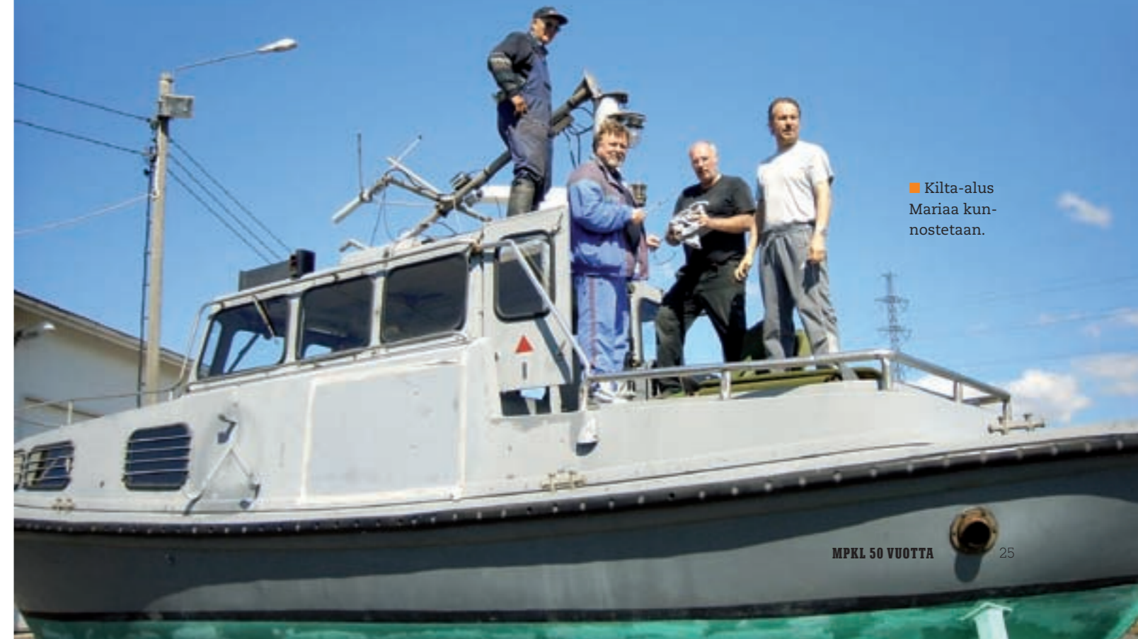
Kilta-alus Mariaa kunnostetaan.