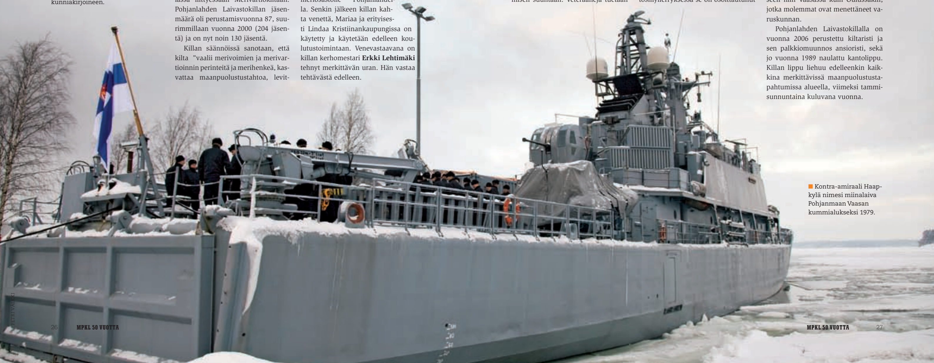
■ Kontra-amiraali Haapkylä nimesi miinalaiva Pohjanmaan Vaasan kummialukseksi 1979.

Pohjanlahden Laivastokillalla on vuonna 2006 perustettu kiltaristi ja sen palkkiomuunnos ansioristi, sekä jo vuonna 1989 nauttu kantolippu. Killan lippu liehuu edelleenkin kaikkina merkittävissä maanpuolustustapahtumissa alueella, viimeksi tammi-sunnuntaina kuluvana vuonna.