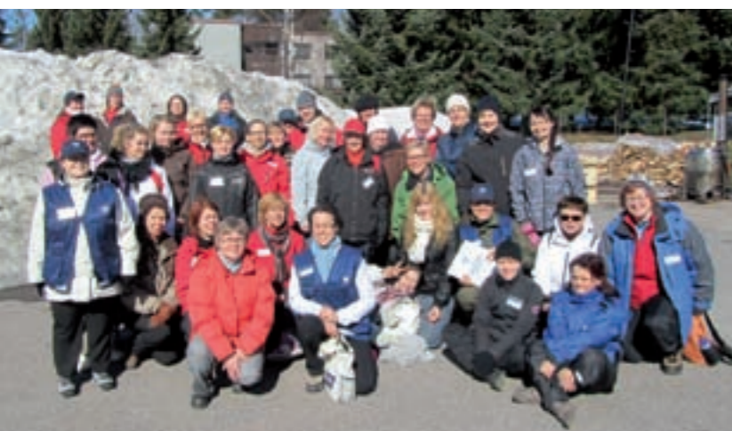
TURVAKURSSIN KILLAN ARKISTO

Sosiaalisen kanssakäymistä ei Killan menoissa unohdeta. Kiltalaiset kokoontuvat vuosittain useita kertoja yhteisiin tapahtumiin. Tarjoilun erikoisuuksiin kuuluvat mm. omalla salaisella reseptillä valmistetut Kiltasinappi ja Kilta-ryyppy.