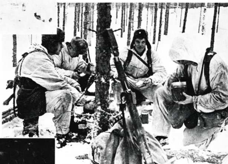
♦ syötiin ...