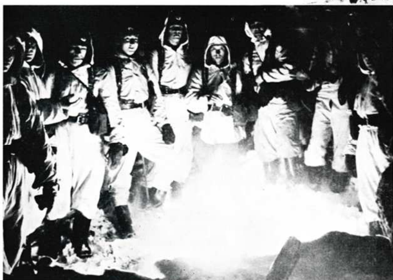
♦ lämmiteltiin ...