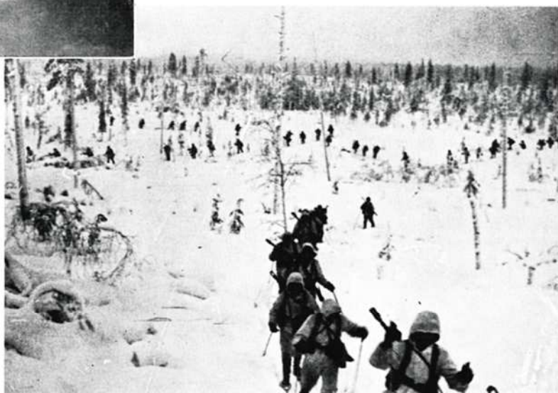
♦ jäähvyäisteltiin ...