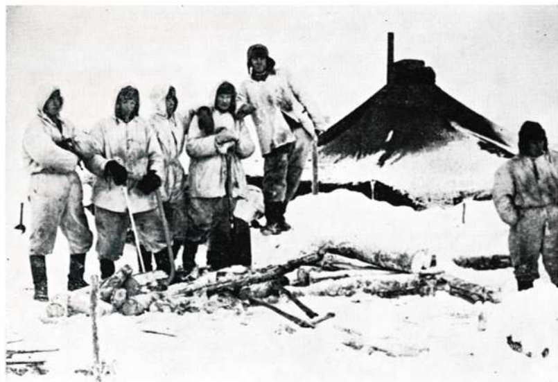
♦ pystytettiin ...