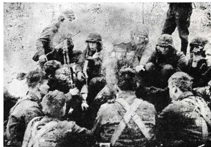
II joukkue on saanut tauon, nuotio sytytetty ja käyrä taas hyvällä mallilla.

25. 8. 60. Koulu miehitti sotkun ym. huoltolaitoksia käsittävän tukikohdan ja puolusti sitä menestyksellä jääkäreitä ym. kokelaita vastaan, joiden halu päästä pimeästä korvesta lihaviin makasiinien luo oli tavaton. Yritykseksi se heiltä kuitenkin jäi.