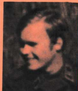
Apuk. Alik. Kaukatie