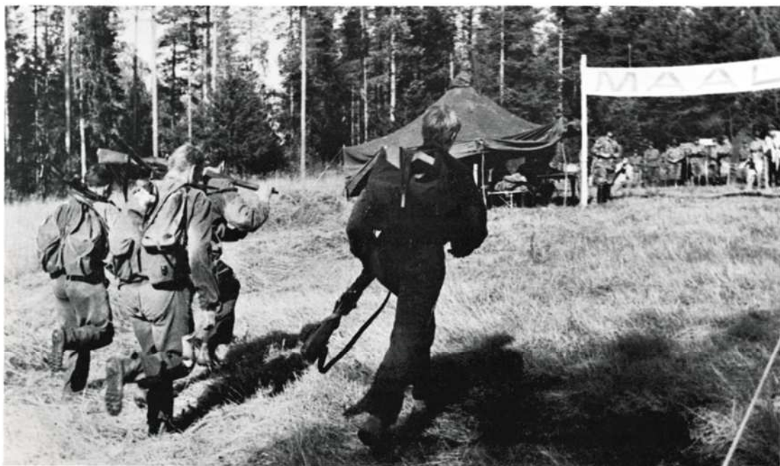
Partiolla on vielä viimeiset metrit ja ehken myös voimat jäljellä.