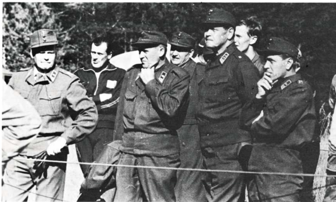
Puolustusvoimain maastomestaruuskilpailujen partiokilpailut ovat käynnissä kenraalien seurattessa maaliin tulevia partioita.

Huolimatta monista yrityksistä ei missään ole luovuttu perinteellisistä sotilasarvoista - kaikkialla on siis tunnustettu sotilasperinteiden velvoittava merkitys.