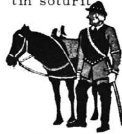
Viipurin Rykmentin soturit