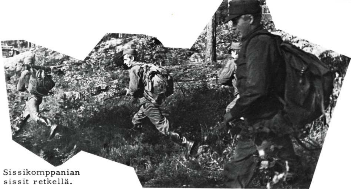
Sissikomppanian sissit retkellä.

Tällainen on siis koulutuksen yleinen kulku Karjalan Jääkäripataljoonassa. Huomaat, että se sisältää paljon työtä ja vaivaa, mutta onneksi myös on vapaa-aikaa. Tyypillistä Karjalan Jääkäreille on se, että me pyrimme erottamaan jyrkästi palveluksen ja vapaa-ajan toisistaan. Kovan työn jälkeen seuraa vapaa-aika, jolloin on aikaa hengähtää ja rentoutua.