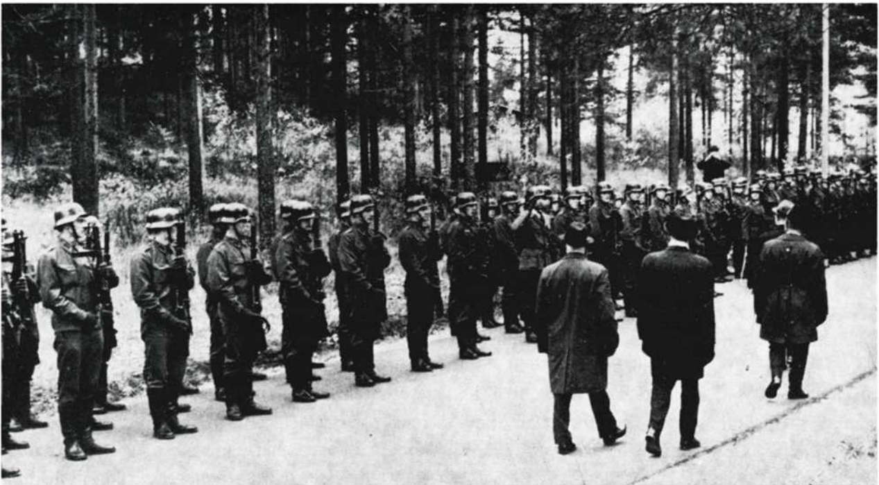
Vanha ja uusi polvi kohtaavat. Kollaan taistelijat tarkastavat pataljoonaa.

Sotajen kaatuneiden, haavoittuneiden, kärsineiden ja eloonjääneiden yhteisin ponnistuksin kirjoitettiin Suomen historiaan sanat »Kollaa kesti».