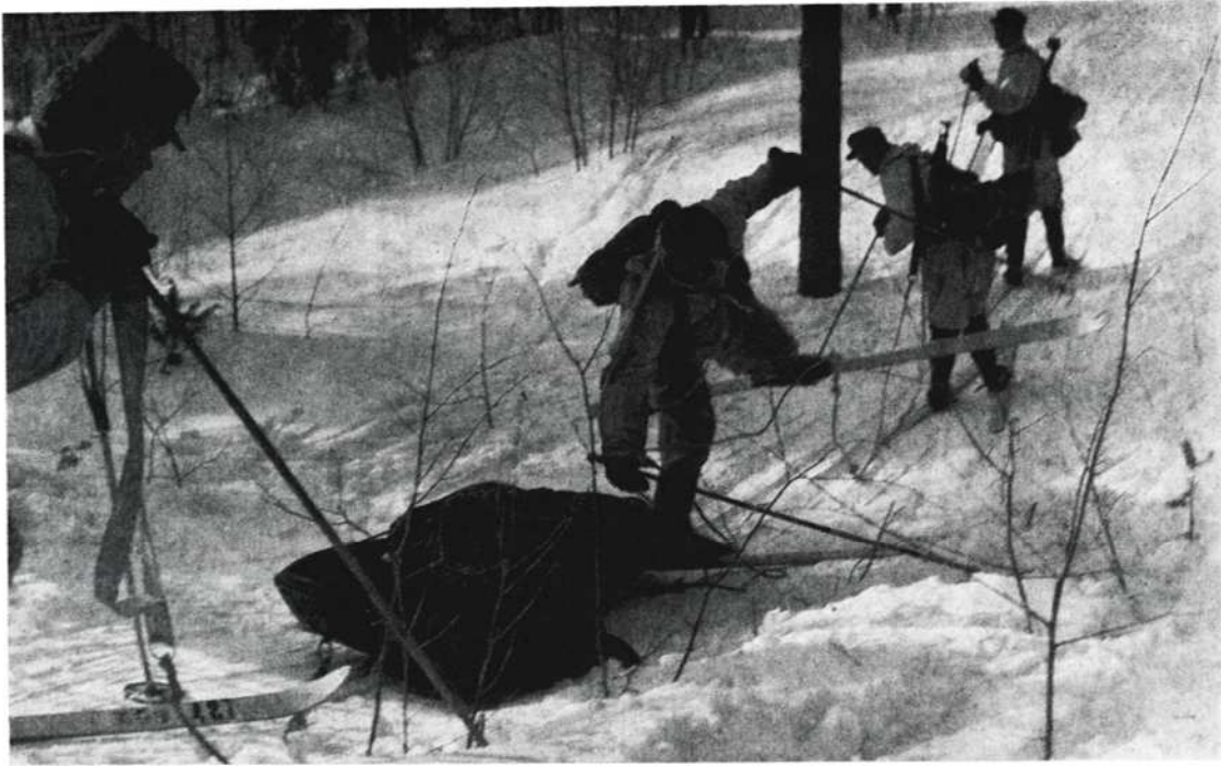
»Elekee vettee, mie kuavun...» Jääkärikilpailun vaikeuksia.

deksään jne. Yksikön saavuttamat pisteet laskettiin yhteen ja jaettiin osallistujien määrällä. RAUK voitti kilpailun ja saavutti tuloksen 9.37, tulosta on pidettävä erittäin hyvänä.