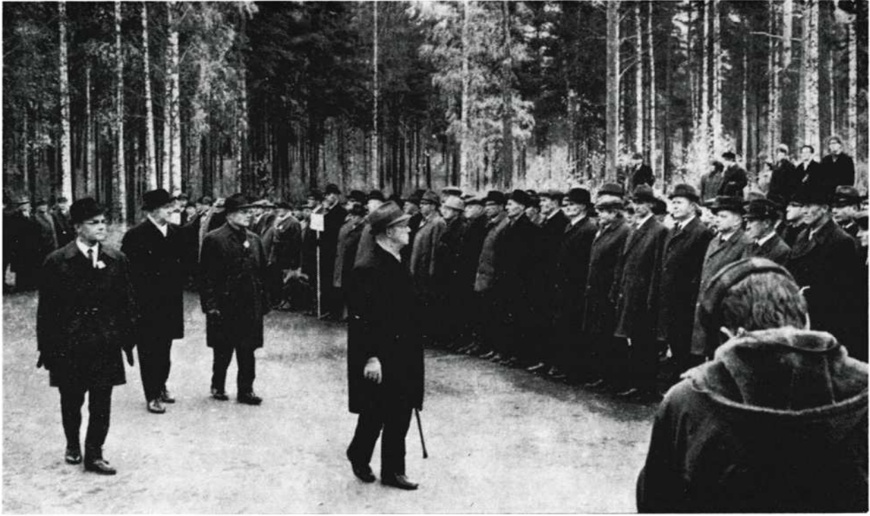
Kollaani miehiä paraatikatselmuksessa varuskunnassa.